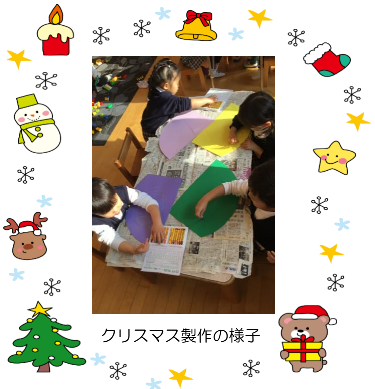
クリスマス製作の様子

子ども達はサンタさんが大好きで す。クリスマスにサンタさんがトナカ イのそりに乗って来てくれるのを楽 しみに待ちながら眠ることでしょう う! もしも子どもに「サンタクロースって ほんとうにいるの?」と聞かれたら、 「いるよ!」と答えられる大人であり たいですね。それが子どもに対する 愛情です。いつまでも子ども達に夢を 与えて下さいね。